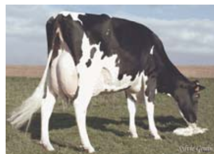
VALIOSA EX 3* X SHOTTLE