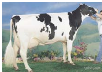
TARA MB88 X SANCHEZ